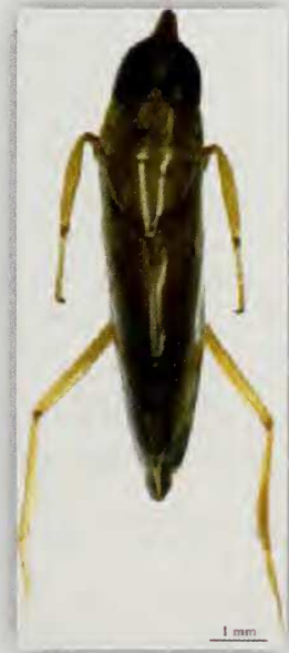
Fig. 5.- Habitus de Anisops sardeus sardeus H-S. (♂)